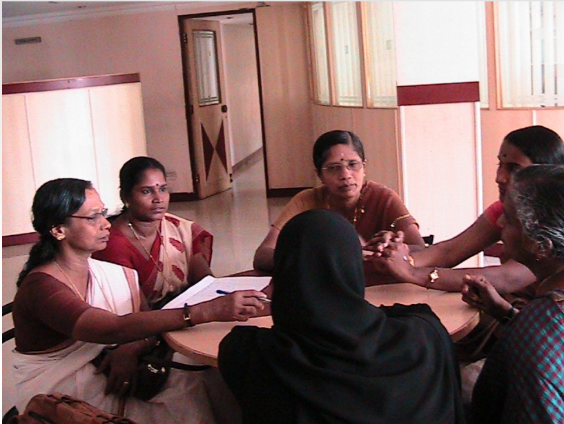
Group discussion in Kannur training