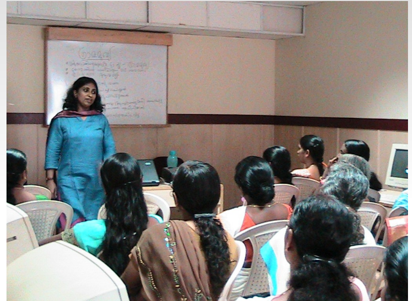
Training in Kannur