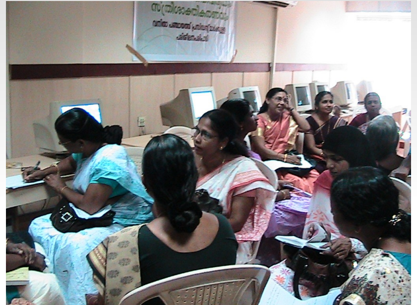
Preparing discussion notes