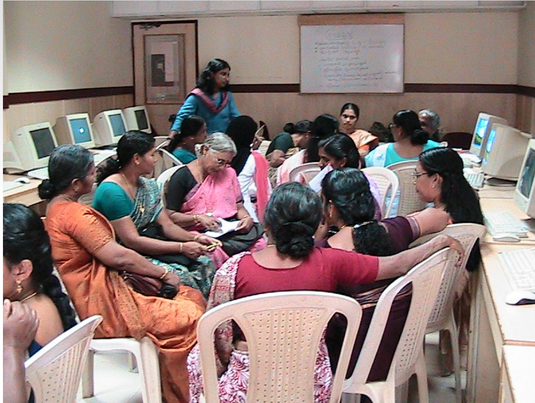
Group discussion, Kannur