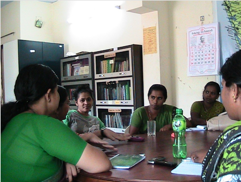
Discussion with Mahila Samakhya Members